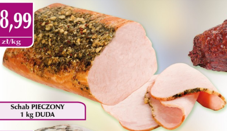
Schab PIECZONY 1 kg DUDA