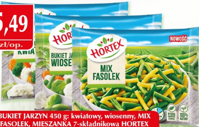
BUKIET JARZYN 450 g: kwiatowy, wiosenny, MIX FASOLEK, MIESZANKA 7-składnikowa HORTEX