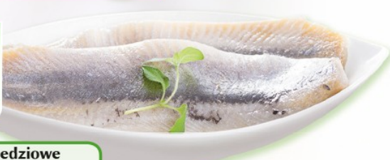
Filety śledziowe a'la matjas 1 kg