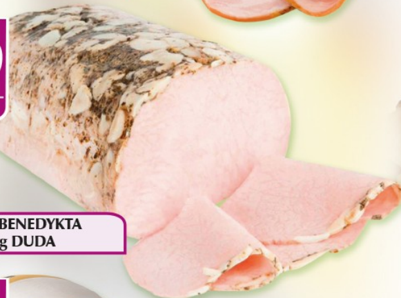
Schab BENEDYKTA 1 kg DUDA