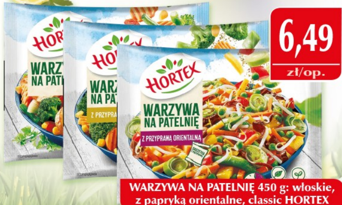
WARZYWA NA PATELNIĘ 450 g: włoskie, z papryką orientalne, classic HORTEX