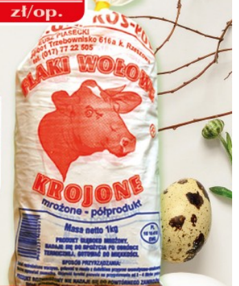
Flaki wołowe 1 kg KOS-POL