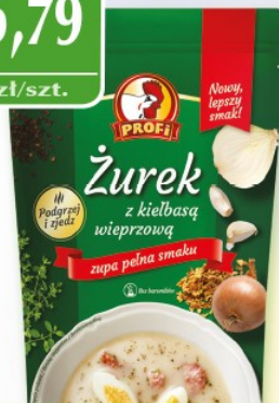
Zupa żurek z kielbasą 450 g PROFİ