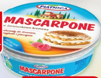
Ser MASCARPONE 250 g PIĄTNICA