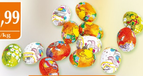
Jajko czekoladowe /praliny/ 1 kg BARON