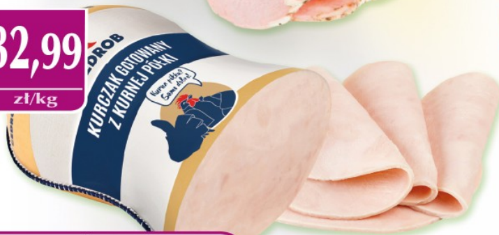
Kurczak GOTOWANY z KURNEJ PÓŁKI 1 kg CEDROB