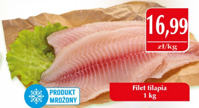
Filet tilapia 1 kg