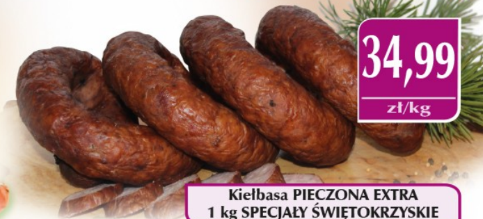
Kielbasa PIECZONA EXTRA 1 kg SPECJAŁY ŚWIĘTOKRZYSKIE