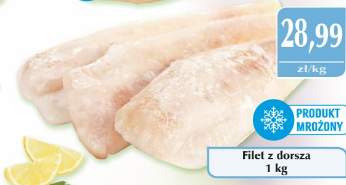
Filet z dorsza 1 kg